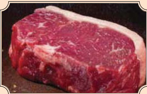
Rumpsteak aus dem Roastbeef geschnitten, mit typischem Fettrand, kräftig im Geschmack