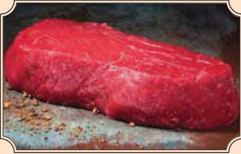
Hüftsteak fein marmoriert, herzhaft