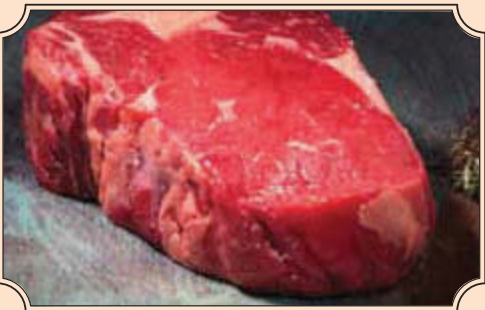
Rib-Eye aus dem Zwischenrippenstück mit charakteristischem Fettauge, saftig und aromatisch