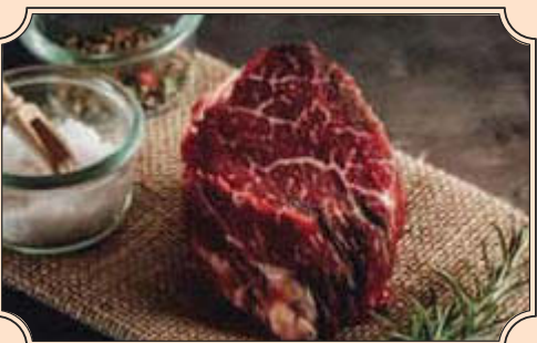
Rinderfilet das Edelstück aus der Rinderlende, sehr zart